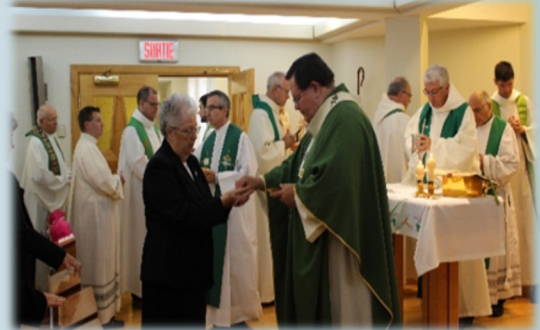
Célébration de la bénédiction

presque complet. La célébration de bénédiction présidée par le Cardinal Lacroix le dimanche 23 septembre 2018, suivie d'un après-midi de « visitation » du public où 250 personnes se sont présentées, ont confirmé la vocation de la résidence de l'avenue Giguère. Tous, à commencer par les séminaristes et l'équipe de formation, ont constaté qu'un nouveau style de vie s'est imposé et devrait favoriser la formation des futurs prêtres du Diocèse de Québec et de ceux provenant d'autres diocèses.