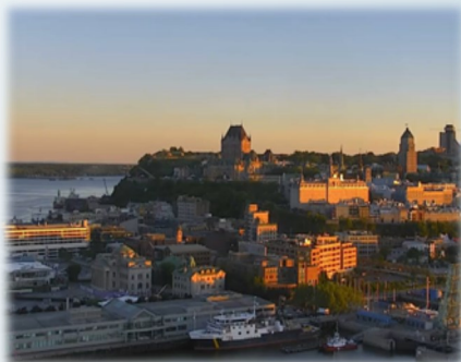
Grand Séminaire de Québec dans le Vieux-Québec

D'abord, il est de mise de constater que la formation des futurs prêtres doit s'adapter à la culture du milieu afin d'y porter l'Évangile d'une manière toujours nouvelle et adaptée. Ensuite, il ne faut pas ignorer la réalité : les jeunes sont hésitants à décider de leur avenir, notre société prend position de façon critique face à l'Église catholique, l'Église elle-même essaie de se