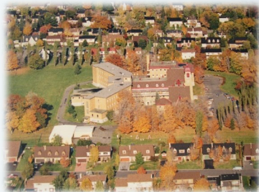
Grand Séminaire à Sillery

repositionner face aux nouveaux défis tout en étant ralentie par des résistances de ses membres, et la réorganisation du système paroissial semble semer des doutes. À Rome, une révision majeure de la formation dans les séminaires aboutit dans l'énoncé de nouvelles normes ( Ratio Fundamentalis Institutionis Sacerdotalis , 8 décembre 2016) ; au Canada, la Conférence des évêques du secteur francophone reçoit l'approbation d'une nouvelle Ratio (17 mai 2017) ajustée au contexte national. Dans ce contexte de « changement d'époque » (Pape François, Florence, novembre 2015), l'archevêque de